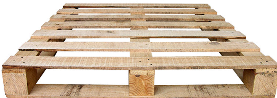
TARIMA TACÓN ESTÁNDAR (FABRICADA) CON MATERIALES RECICLADOS